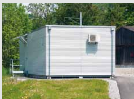
Grossraumkabine mit Flachdach und Alufassade.