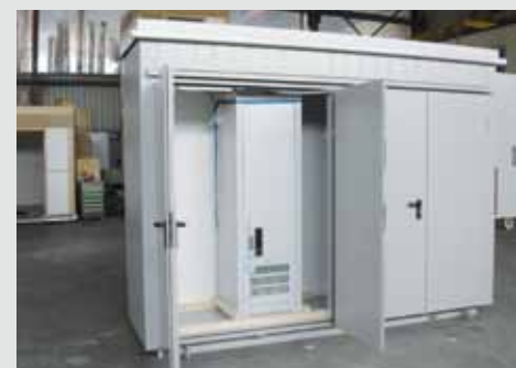
Schrankkabine mit Alufassade, in allen Dimensionen und Farben erhältlich. Anzahl Türen nach Kundenwunsch.