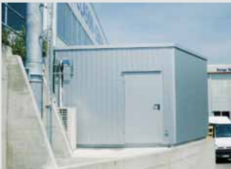
Technikkabine mit Flachdach und Alufassade. Lieferbar in verschiedenen Farben (nach Kundenwunsch).

Ob gross oder klein, ob Stadt oder Land – unsere Technikkabinen sind ideal für den vielseitigen Einsatz