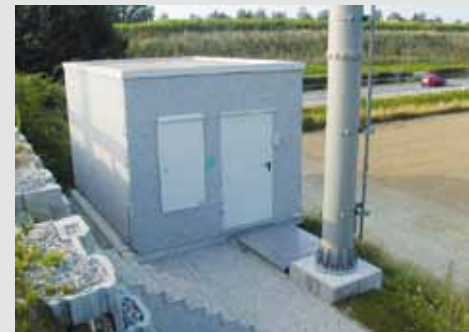
Technikkabine mit Flachdach und Inkalitfassade. Die Aussenhülle erweckt den Eindruck einer Betonkabine.