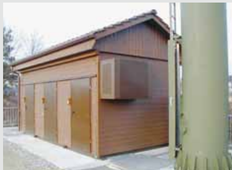
3er-Technikkabine für unterschiedliche, unabhängige Nutzer am gleichen Standort. Mit Giebeldach und Châlet-schalung.