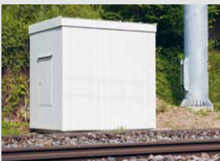
Kabine zum Schutz für mobile Funknetze und Kontrollsysteme.